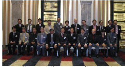
平成22年(第11回日免研総会)

日時：平成24年10月28日(日) 場所：学士会館210号室 役員会210号室 会費：参加費 8,000円 懇親会参加費 2,000円